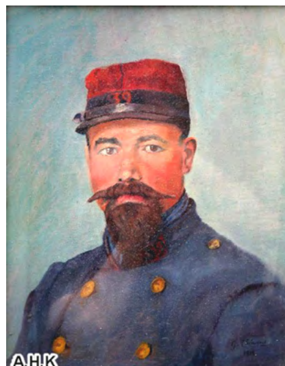
Soldat de l'époque dans son uniforme traditionnel

Pourquoi ont-ils "OPTÉ" s'ils n'avaient pas l'intention de partir : Par défi, Par patriotisme, parce qu'ils avaient été SOLDAT FRANÇAIS ? Il apparaît aussi que certains avaient "MAL OPTÉ". En effet, les autorités allemandes ne considéraient comme VALABLES que les options déposées en Sous Préfecture (KREISEITUNG).