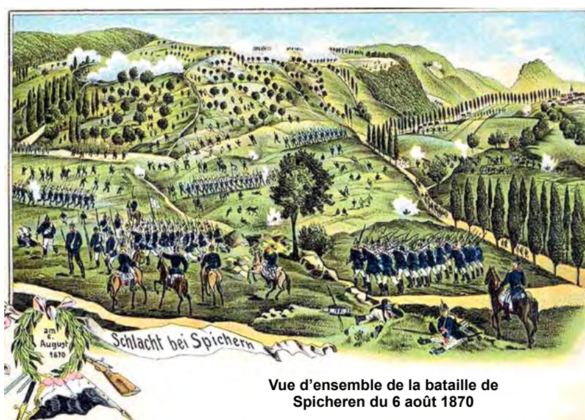
Vue d'ensemble de la bataille de Spicheren du 6 août 1870