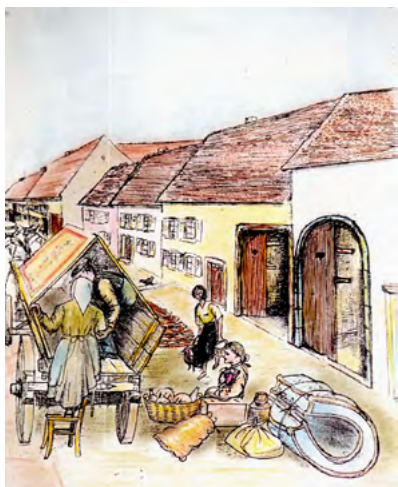
"L'exode" par Antoine SPOHR

Mais l'animation de la vie communale n'aurait pas de consistance sans l'apport des associations et des bénévoles qui les gèrent. Ainsi régulièrement nous relevons l'engagement de certains d'entre eux. La médaille d'honneur de la commune est une décision récente du conseil municipal. Il était temps, en effet, de souligner la disponibilité et le dévouement, sur une très longue durée de certains de nos concitoyens.