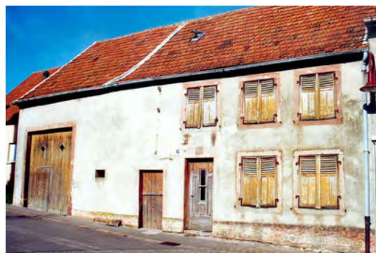
La Maison des Arts et des Traditions 4, rue de l'Eglise en 2001

Joseph WACK a montré l'étendue de ses connaissances de l'histoire locale et en particulier de l'histoire de Rouhling qu'il nous conte depuis plus de trente ans dans notre bulletin municipal. Ses contributions à toutes les animations patrimoniales ont enrichi le rendu à la population. Pour ne citer qu'un seul exemple : la Maison des Arts et des Traditions qui lui doit beaucoup.